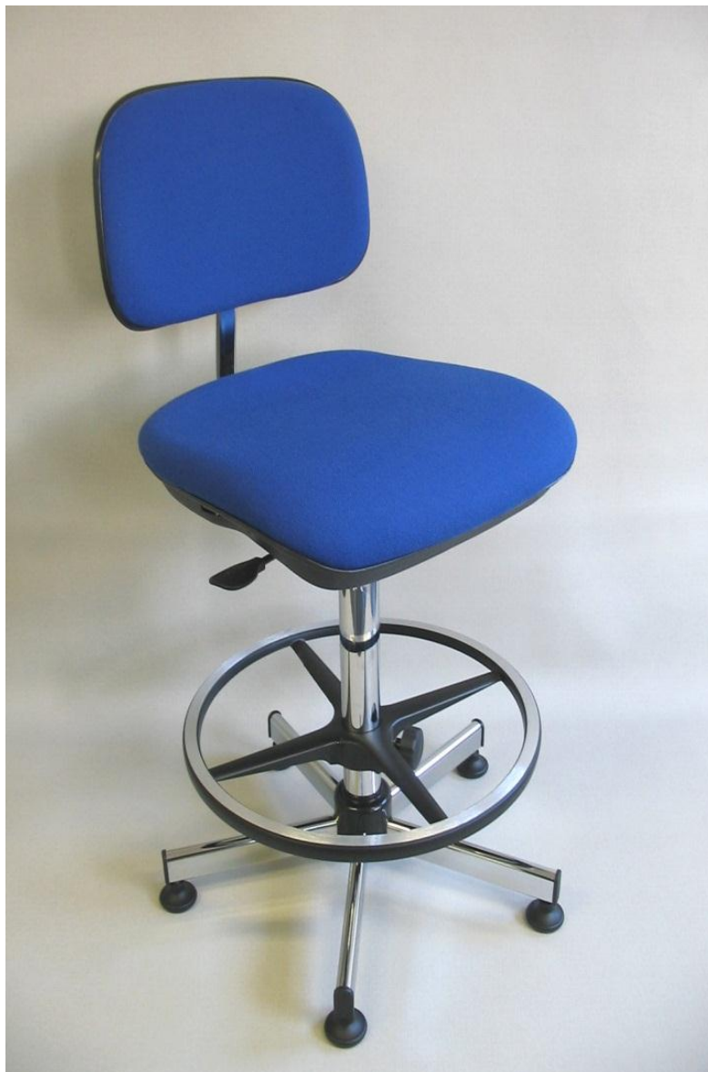
Visuel du siège 22 avec repose-pieds RP