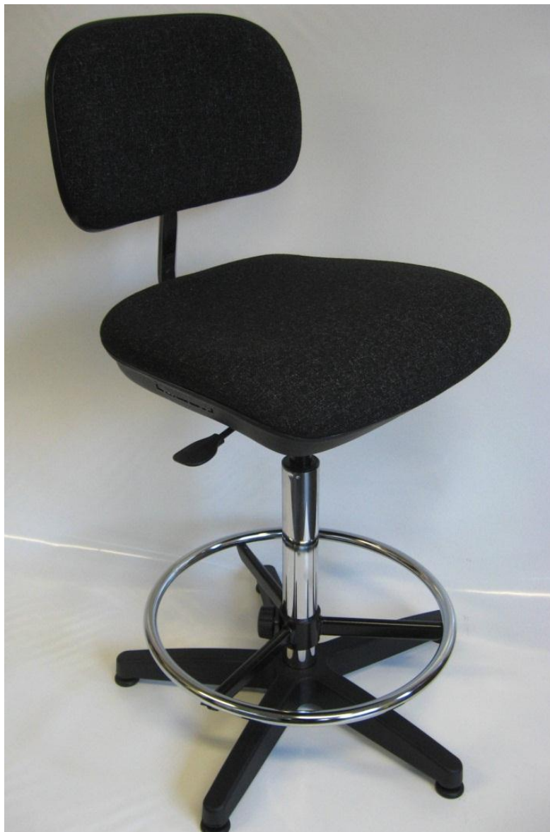
Visuel du siège N22 avec repose-pieds RPTL