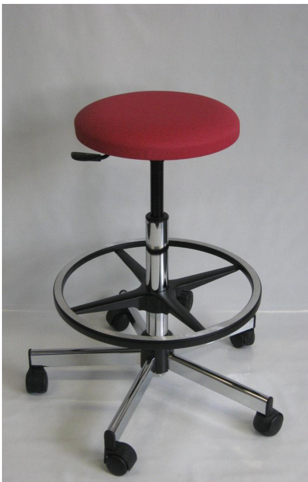
Visuel du tabouret 13 avec repose-pieds RP

Pour faciliter le nettoyage et la décontamination, le dessous de cette assise est recouvert par une feuille de vinyle étanche. L'assise, qui ne comporte pas d'agrafe, est exempte d'impuretés.