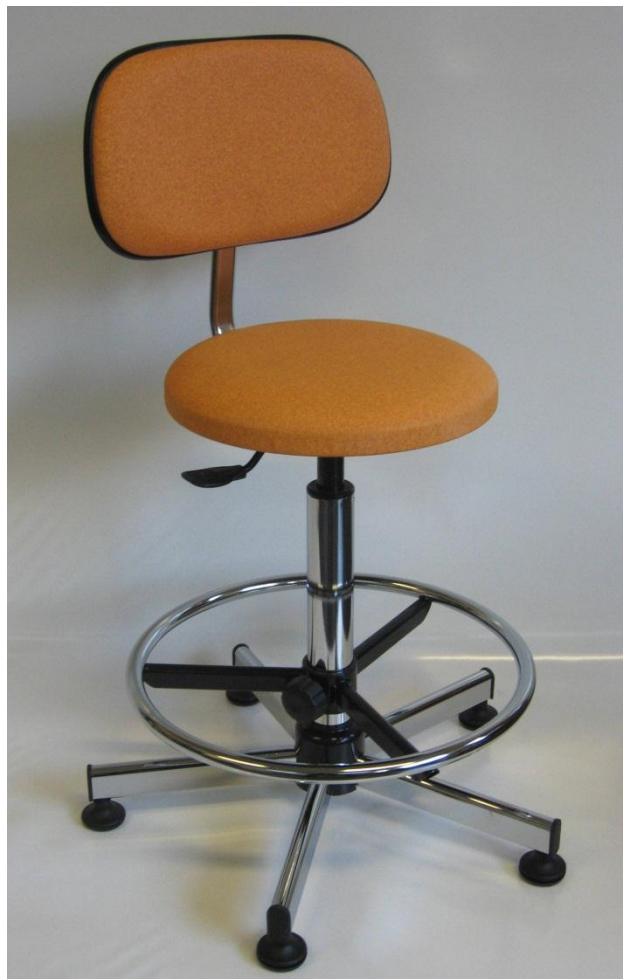
Visuel du tabouret 13D avec repose-pieds RPTL

Pour faciliter le nettoyage et la décontamination, le dessous de cette assise est recouvert par une feuille de vinyle étanche. L'assise, qui ne comporte pas d'agrafe, est exempte d'impuretés.