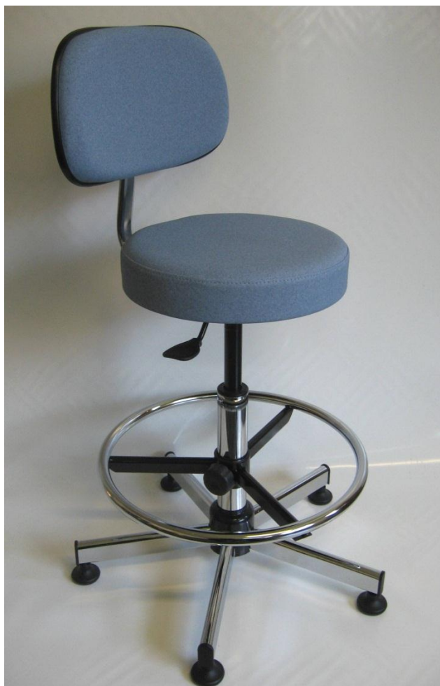
Visuel du tabouret 19D avec repose-pieds RPTL

Pour faciliter le nettoyage et la décontamination, le dessous de cette assise est recouvert par une feuille de vinyle étanche. L'assise, qui ne comporte pas d'agrafe, est exempte d'impuretés.