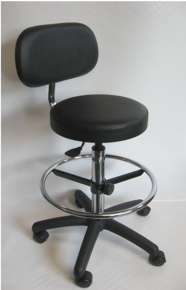
Visuel du tabouret N19D avec repose-pieds RPTL

Pour faciliter le nettoyage et la décontamination, le dessous de cette assise est recouvert par une feuille de vinyle étanche. L'assise, qui ne comporte pas d'agrafe, est exempte d'impuretés.